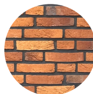
metselwerk in oranje