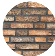
metselwerk in bruin/taupe