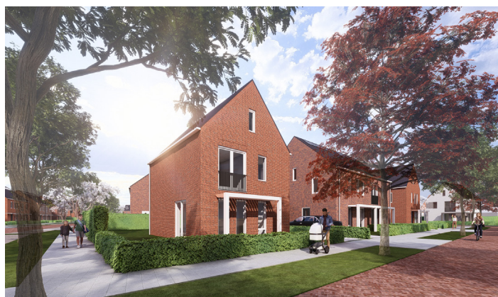
beelden van de projectwoningen voor Heldersveld