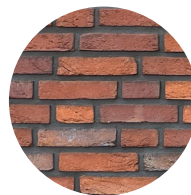
metselwerk in rood