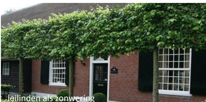
leilinden als zonwering